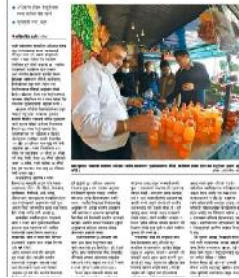
राजमार्गका होटलमा अखाद्य

जिल्ला प्रशासन कार्यालयले समय समयमा सदरमुकाम र राजमार्गस्थित पसल तथा होटलहरूको अनुगमन गर्ने गरेको छ । यसका अतिरिक्त विभिन्न समयमा सेवाग्राहीबाट आएका गुनासाहरू सम्बोधन गर्न आवश्यकता अनुसार आकस्मिक निरीक्षण समेत गरिएको छ ।